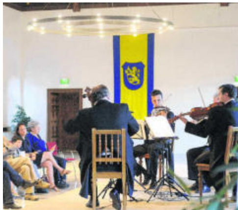
Die vier Streicher vom Württembergischen Kammerorchester Heilbronn zogen die Zuhörer in Meßkirch in ihren Bann.

Das Konzert des Württembergischen Streichquartetts am Sonntagabend bewies, dass der Meßkircher Schlosssaal für überregionale Veranstaltungen immer attraktiver wird. Das Konzert war eine von 14 Veranstaltungen der Musik-Festwochen Donau-Oberschwaben zwischen Beuron, Aulendorf und Hayingen. Guntram Bumiller, der künstlerische Leiter der Festwochen, begrüßte die Besucher, stellte das neue Konzept der Festwochen vor, die von namhaften Sponsoren unterstützt und von zehn Gemeinden der Region getragen werden.